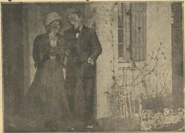
Den evig forelskede.