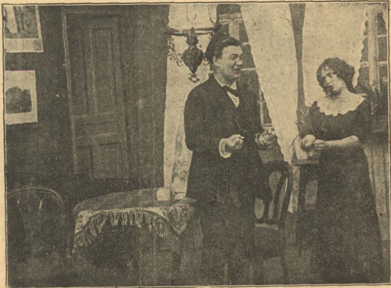
Som sædvanlig uheldig.