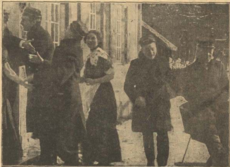
Ankomsten til Nøddebo.